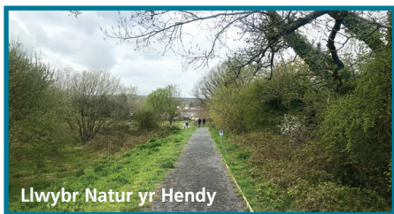
Llwybr Natur yr Hendy

Mae ein gwirfoddolwyr, gyda chymorth y Gwasanaeth Prawf, yn dal yn weithgar ac yn helpu cynnal a chadw'r safle, er budd natur. Mae esiamplau o'r hyn sydd wedi'i wneud yn ddiweddar yn cynnwys gosod bocsys adar newydd, biniau ac hysbysfyrddau, a sefydlu llwybr hwyli i'r plant. Erbyn hyn mae gennym uwch-gynllun ecolegol 5 mlynedd a fydd yn helpu'r gwirfoddolwyr i gydweithio gyda'r Cyngor Cymuned yn y gwaith o wella'r cynefinoedd. Mae'r safle yn cael ei hysbysu ar y cyfryngau cymdeithasol, ac mae dros 600 yn ei ddilyn ar Facebook (@Hendy Nature Trail). Mae'r gwirfoddolwyr wedi sefydlu cyfrif Flickr er mwyn arddangos peth o'r lluniau gwych o'r bywyd gwylt sydd i'w weld ar y safle. Rhown groeso cynnes i wirfoddolwyr newydd.