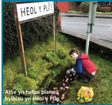
Alfie yn helpu plannu bylbiau yn Heol y Plas