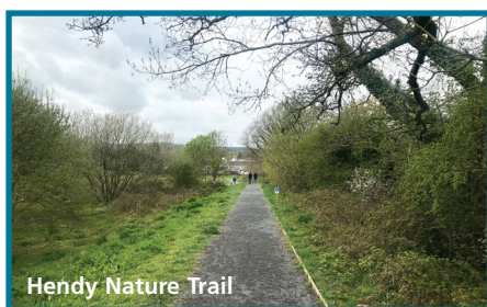
Hendy Nature Trail

Our volunteers, aided by the Probation Service, are still active in helping maintain the site for nature. New bird boxes, bins, an information board, and a fun children's trail are just a few examples of what's happened lately. We've also now got a 5 year ecological master plan which will help the volunteers to work with the Community Council in improving the habitats. The site has an active social media presence, with over 600 followers on Facebook (@HendyNatureTrail). Volunteers have set up a Flickr account to display some of the fantastic photos of wildlife on the site. New volunteers are welcome.