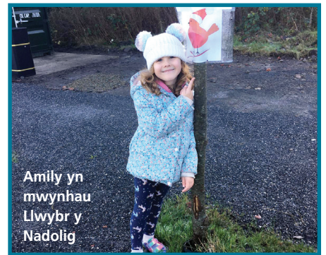
Amily yn mwynhau Llwybr y Nadolig

Yn ystod y pandemig, roedden ni hefyd wedi cydweithio gyda phartneriaid eraill megis Gyndeithasau Rhieni ac Athrawon Ysgolion yr Hendy a Thygroes a Chylch Cyfeillgarwch Llanedi i ddosbarthu llwybrau Calan Gaeaf a Nadolig o gwmpas y pentrefi. Diolch yn fawr i bawb.