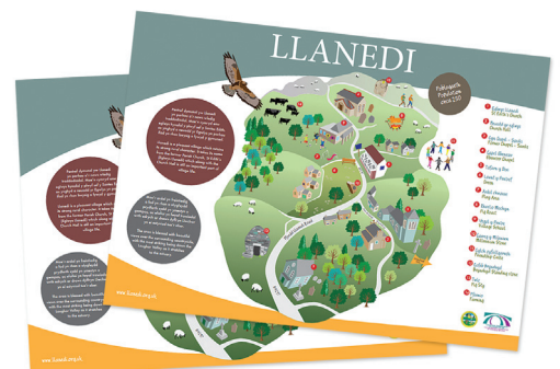
One of 3 illustrated maps created for the community council area

The report is a useful reflection of what the council has done over the last year, and demonstrates how we are helping our community and contributing to regional and national wellbeing goals.