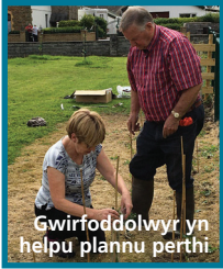
Gwirfoddolwyr yn helpu plannu perthi

Mae'r gwaith ar y prosiect hwn, sy'n cael ei ariannu gydag arian o Gronfa Lleoedd Lleol ar gyfer Natur y Loteri Genedlaethol, yn datblygu'n dda.