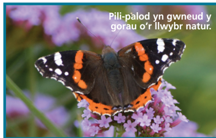
Pili-palod yn gwneud y gorau o'r llwybr natur.

Gallwch ddilyn hynt y llwybr ar Facebook @HendyNatureTrail a Flickr. Mae wastad croeso cynnes i wirfoddolwyr newydd.