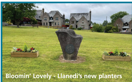
Bloomin' Lovely - Llanedi's new planters