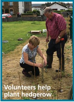
Volunteers help plant hedgerow

Work is progressing on this National Lottery Local Places for Nature funded project.